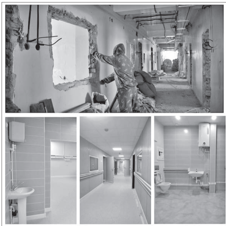
Инфекционное отделение: в начале капитального ремонта и в настоящее время

- Цифровой флюорограф позволяет более точно диагностировать заболе-