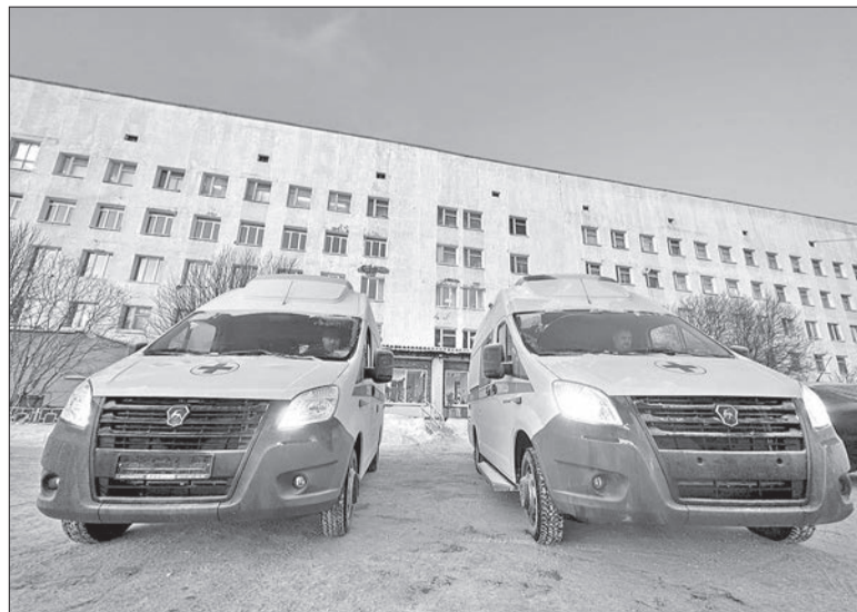
Новые машины скорой помощи